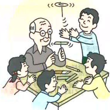
●工作などの文化活動