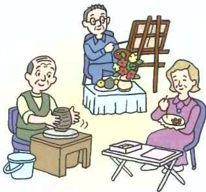
●手芸・陶芸・絵画などのグループ活動