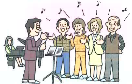
●コーラス・合唱団などのグループ活動

スポーツ安全保険は、昭和46年に募集を開始して以来、多くの方にご加入いただいております。その中で、文化活動を行う方々についても約30万人のご加入があり、近年、ご加入者が増加しております。貴団体におかれましても、活動中や、自宅と活動場所との往復途上の万一のケガや賠償責任の事故の備えとして、スポーツ安全保険にご加入されることをお勧めします。